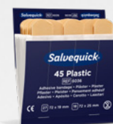
Salvequick Plastplåster REF 6036

Limfritt, självhäftande plåster som lätt kan rivas av efter önskad storlek. Passar på alla typer av sår oberoende av värme, kyla, vått eller torrt. Sitter kvar i vatten. Refill till Wound Care Dispenser.