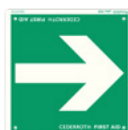
RIKTNINGSPIL REF 1735 Dubbelzijdig. Efterlysende 20 x 20 cm