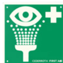
ÖGONDUSCH REF 1740 Dubbelzijdig. Efterlysende 20 x 20 cm