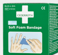
Cederroth Soft Foam Bandage Blue 2 m REF 51011011

Minskar risken för kontakt mellan hjälpare och skadad. Innehåller andningsmask med backventil, 2 par handskar och 2 st Cederroth Safety Hand Cleaners.