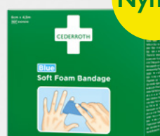
Cederroth Soft Foam Bandage Blue 4,5 m REF 51011010

Limfritt, självhäftande plåster som lätt kan rivas av efter önskad storlek. Passar på alla typer av sår oberoende av värme, kyla, vått eller torrt. Sitter kvar i vatten. Refill till First Aid & Burn Station.