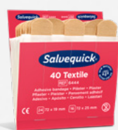
Salvequick Textiplåster REF 6444

Varje refill innehåller 45 plåster (27 st 72 x 19 mm och 18 st 72 x 25 mm). 6 refiller/ask.