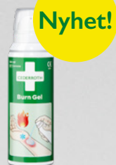
Cederroth Burn Gel Spray REF 51011005

Blått Hydrogelplåster som skyddar och lindrar vid mindre brännsår. Burn Cover är också lämplig för mindre skärsår och skrubsår. Vattentäta och sterila.