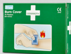
Cederroth Burn Cover REF 901903

Blått Hydrogelplåster som skyddar och lindrar vid mindre brännsår. Burn Cover är också lämplig för mindre skärsår och skrubsår. Vattentäta och sterila.