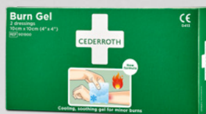
Cederroth Burn Gel Dressing REF 901900

Vattenbaserad gel för mindre brännskador, skällningar och solsveda. Fungerar som en tillfälligt skyddande barriär som kyller och lugnar huden och därmed minskar smärtan. Kan användas flera gånger.