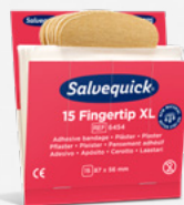
Salvequick Fingertoppsplåster REF 6454

Varje refill innehåller 40 plåster (24 st 72 x 19 mm och 16 st 72 x 25 mm). 6 refiller/ask.