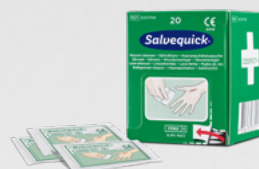
Salvequick Sårvtvättare 20 st REF 323700

Sterilt universalförband med 4 funktioner: Tryck-, stöd-, täck- och brännskadeförband.