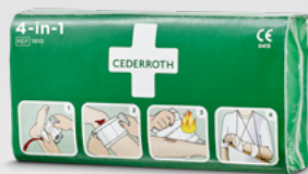
Cederroth 4-in-1 Blodstoppare REF 1910

Sterilt universalförband med 4 funktioner, speciellt lämpligt för fingrar och tår.