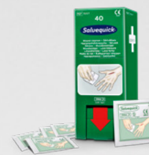
Salvequick Sårvtvättare 40 st REF 3227

Steril, fysiologisk koksaltlösning, styckförpackade. Refill till Första Hjälpen-stationen.