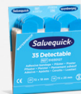
Salvequick Blue Detectable REF 51030127

Extra mjuka och följsamma. Detekterbara i de flesta metalldetektorer som används inom livsmedelsindustrin. Varje refill innehåller 30 plåster (15 st 66 x 39 (22) mm och 15 st 72 x 19 mm). 6 refiller/ask.