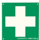
FÖRSTA HJÄLPEN KORS REF 1738 Dubbelzijdig. Efterlysende 20 x 20 cm