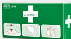
Cederroth Skyddspaket REF 2596

Steril, fysiologisk koksaltlösning, styckförpackade. Refill till Wound Care Dispenser.