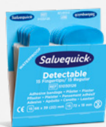
Salvequick Blue Detectable Mix Fingertip/Regular REF 51030126

Varje refill innehåller 15 plåster (87 x 56 (23) mm). 6 refiller/ask.